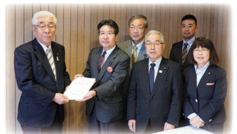
昨年度の提出（2019年11月）