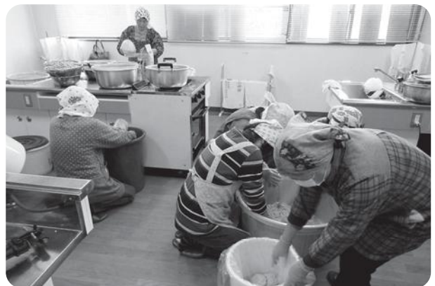
作業を分担しながら、手際よく仕込みました。

終了後には、紅大豆みそとの味比べを したり、管理の仕方や市販のみそとの違 いについてなどの話もお聞きし交流を深 めました。