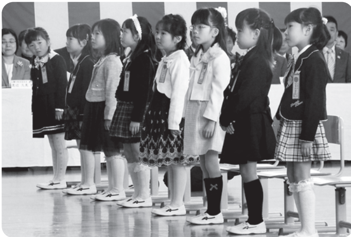
新しい学校生活に胸を膨らませる一年生。起立した時の姿勢がとても立派です、と校長先生にほめられました。