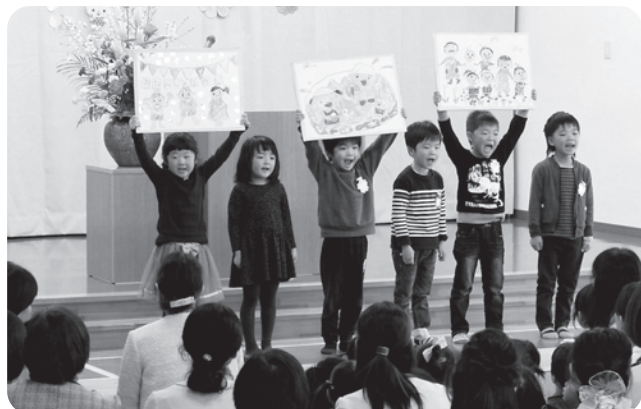
自分たちで描いた絵を使って、園での楽しいことなどを発表して新入园児を歓迎してくれた年長児たち。

さくらの保育園には、鮎貝と蚕桑の子どもたちの他、地区外からも入园されており、現在は166名と、昨年の同時期に比べ16名程少なくなっているようです。