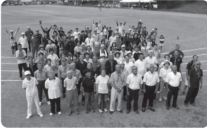
見事に三連覇を達成された赤組の皆さん、おめでとうございます。 (組毎に撮影した集合写真から)