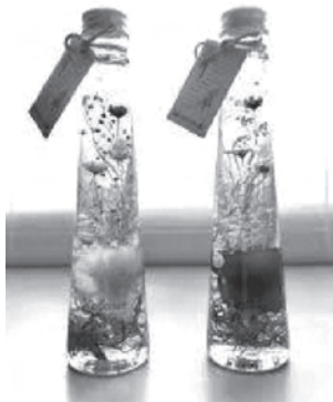
(写真はイメージです)