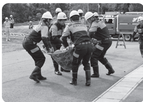
毛布を利用して人が運ぶ訓練（上）と日赤青年奉仕団による 応急手当の訓練（右）