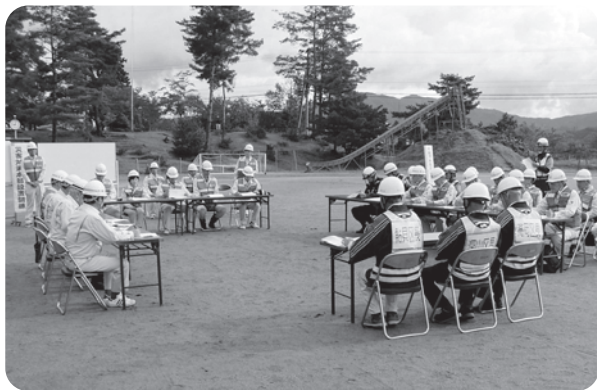
被害状況の把握とその対策が話し合われた 災害対策本部設置訓練

白鷹町大字鮎貝3994番地7 TEL 85-2342 / FAX 85-2341