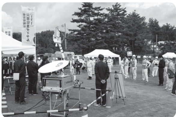
NTTの協力で災害伝言ダイヤル「171」 の体験も行われました