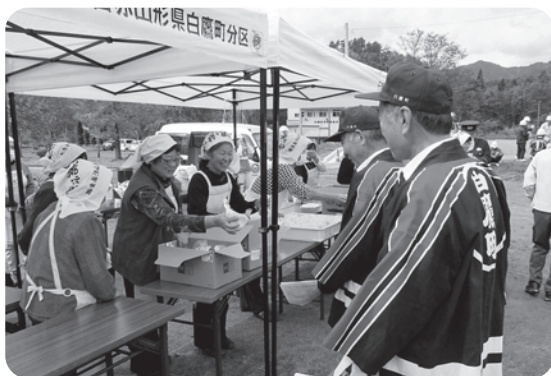
訓練終了後には、日赤奉仕団による炊出し 訓練のおにぎりが振舞われました

白鷹町総合防災訓練が10月20日、鮎貝小学校グラウンドを主会場に、鮎貝区、高岡区、深山区の各自主防災組織や消防団、日赤わかあゆ会、白鷹町社会福祉協議会など、関係する団体が参加して本番さながらの訓練が行われました。豪雨災害を想定したこの度の訓練は、昭和42年の羽越水害をはじめ、平成25年と26年の豪雨を経験している鮎貝地区にとっては貴重な訓練となりました。様々な機会で防災に関する訓練や研修会などが行われていますが、いざという時のためにも、できる限り参加したいものですし、時々みんなで話し合ってみることも大切なことではないでしょうか。