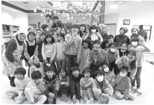
↑だんごさげの後、みんなでポーズ☆