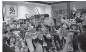
↑だんごさげの様子