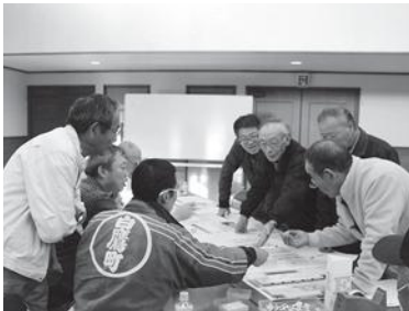
地区民参加型の研修会