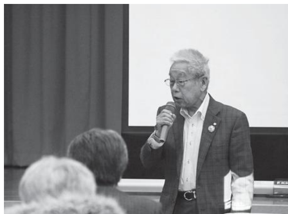
(有) ナカヤマ製作所