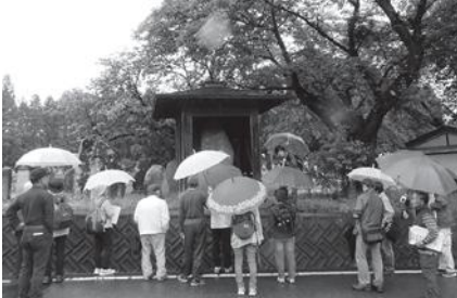
歴史を学んだ蚕桑の散歩路

「地域の資源を活かした地域づくり」を目標として1年間活動してまいりまし。メインの実施である「蚕桑の味じまん」の整理により、昨年準備した課題の当り、昨年同様、桜の里散歩路歴史探訪」の3回に分けてありなが開