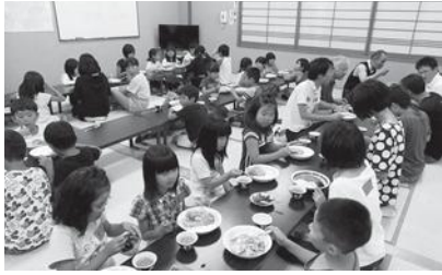
カレーおいしいね

いきてくか地おをキと度た致等の祭たしてん生ん子をしら催題 し思域 また進目部域り計ン秋は。しにつ、た頂でまかど作。た知し「た。うづ昨 す。いん標ですま画グにウ、来ま協ど新文。き食でらもり、夏休み寺子屋では、カレ とで持新こすしとて？