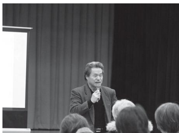
(株) ファースト・カーゴ