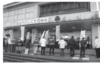
昨年(2020年)の青パト隊出発式の様子

毎週木曜日に行っている青パト車の見守り活動に今年度は延べ61名(26回実施)と大勢の方からご協力いただきました。防犯連絡員をはじめ、民生児童委員、むつみ学級生、更生保護女性会、一般の方が協力いただき、大変ありがとうございました。たくさんの方々の協力により地域の子ども達の見守り活動を継続できていることに心から感謝いたします。子ども達の安全を守る活動にこれからもご協力をお願いいたします。