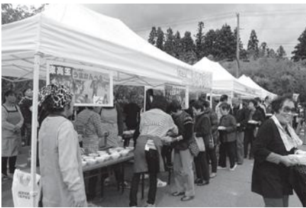
長蛇の列ができた蚕桑の味じまん

とまもるでく桑通イこいる尻の玉 謝ご す回新盛多し楽課ま りを「 思い活よもりのしべのま舞地味芝ま申参加出。にた況くまし題んメ いり動うつに地てンよしい区じ居たし加品。向なにの皆たで整の実事業 またし今な少域、トうたもの「ん期新げたご改めもるにご参加でいたと準備い す。いて後がしづ蚕をな。行「秋てんこもり」の振