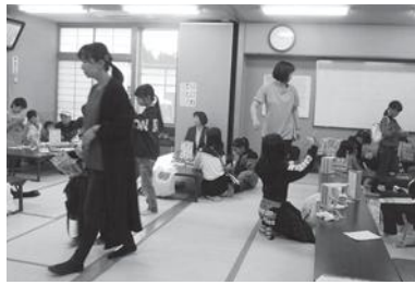
ワークショップ大賑わい

思でにた地で開にをの講すれ容取部ナめいブ ついも新城検催よ知歴習ま。ばにり員いる年ー てき取しに討等るる史会た、とし入のの遊代ス いたりい密を、講語・や、思てれ提設びがや まい組活着重部話り文地介、いた案置コ楽幅ト すとん動しね会の部化域護まけ内を等し広の趣