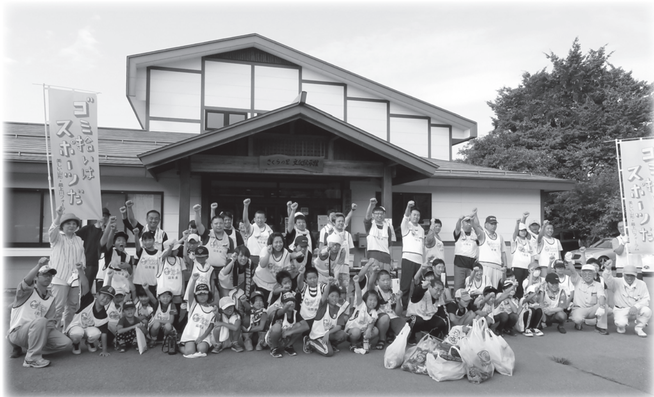
スポーツゴミ拾いに参加した人々