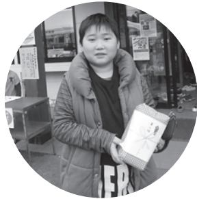
→射的コーナーは大人気