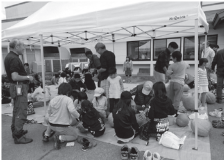
↑おぼけかぼちゃのランタン作り

ホールには、さくらの保育園児、蚕桑小学校児童、白鷹中学校生徒の作品のほか、こぐわキッズや放課後児童クラブ、写真、書道、手工芸品が所狭しと並びました。「蚕桑の味じまん」に参加した方も、終了後はどっとホールに押し寄せ、大勢の方でにぎわいました。屋外では「西田尻10町内友志会」の売店が早くから店開きし、あつという間に売り切れていました。「レインボーブリッジ」の野菜直売も盛況でした。