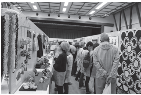
↑素晴らしい作品の数々。多くの方が鑑賞しました。

ホールには、さくらの保育園児、蚕桑小学校児童、白鷹中学校生徒の作品のほか、こぐわキッズや放課後児童クラブ、写真、書道、手工芸品が所狭しと並びました。「蚕桑の味じまん」に参加した方も、終了後はどっとホールに押し寄せ、大勢の方でにぎわいました。屋外では「西田尻10町内友志会」の売店が早くから店開きし、あつという間に売り切れていました。「レインボーブリッジ」の野菜直売も盛況でした。