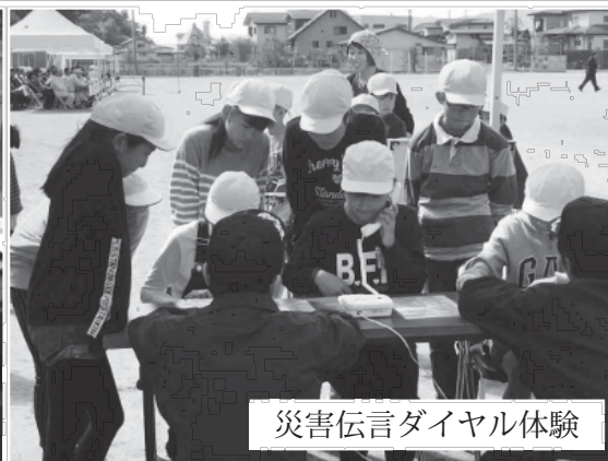
災害伝言ダイヤル体験

10月14日、荒砥小学校を会場に白鷹町総合防災訓練が開催されました。大雨による河川氾濫、浸水、土砂災害等を想定して、町、社会福祉協議会、消防団、荒砥・十王地区の自主防災会が参加し、様々な訓練が行われました。荒砥小学校の避難訓練も行われ、児童が校舎からグラウンドに避難した後、濃煙体験や災害伝言ダイヤルを体験し、煙の中での避難の仕方や災害時に安否や居場所を伝える方法を学びました。