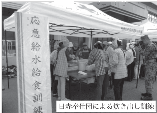
日赤奉仕団による炊き出し訓練