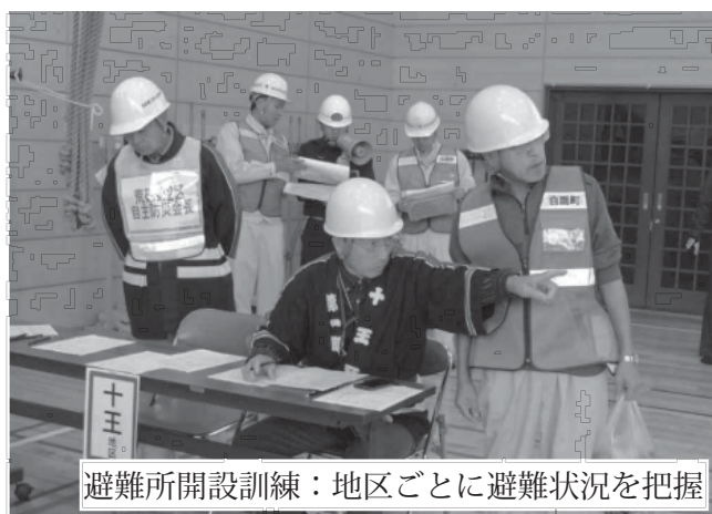
避難所開設訓練：地区ごとに避難状況を把握