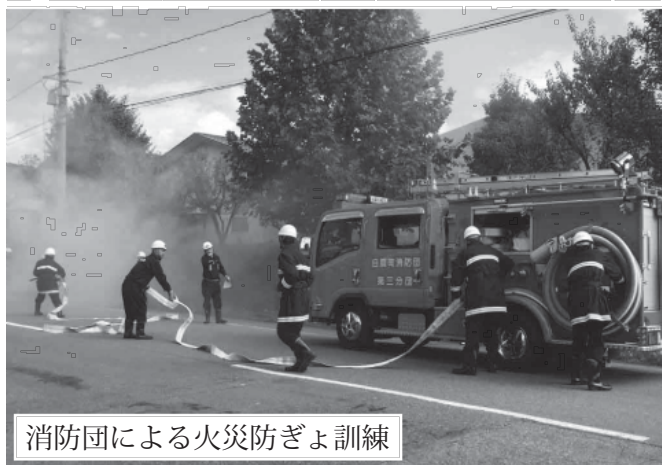
消防団による火災防ぎょ訓練