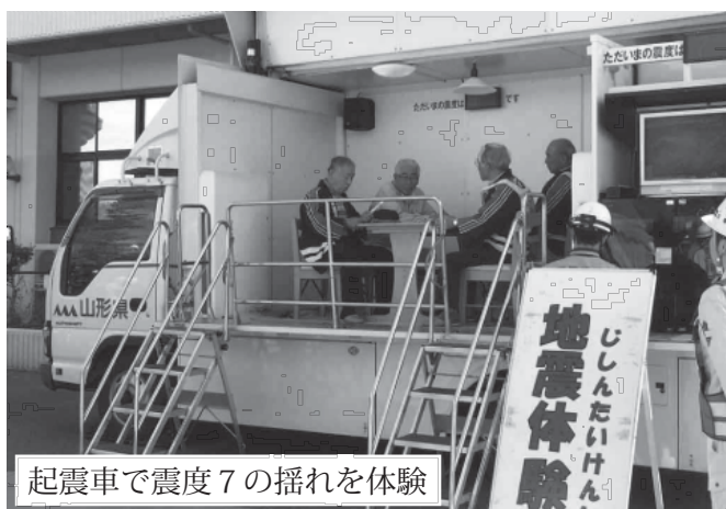
起震車で震度 7 の揺れを体験

十王地区 コミュニティセンター TEL 0238-85-2102 FAX 0238-85-2122