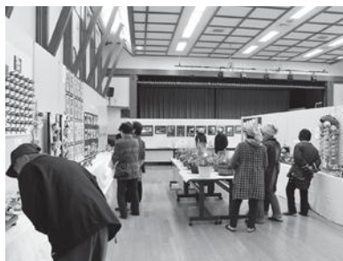
↑熱心に作品を鑑賞する人たち。「蚕桑にもすごい人いるな〜」

ホールには、さくらの保育園児、蚕桑小学校児童の作品のほか、こぐわキッズや放課後児童クラブの作品がにぎやかに並びました。また、地元の方の写真、書道、手工芸品が並び、来館者は「地域にこんなに作っている人がいるんだな」と感心して見ていました。屋外では「西田尻10町内友志会」の焼き鳥、焼きそばの売店、「レイインボープリッジ」の野菜直売があり、多くの方が買い求めていました。