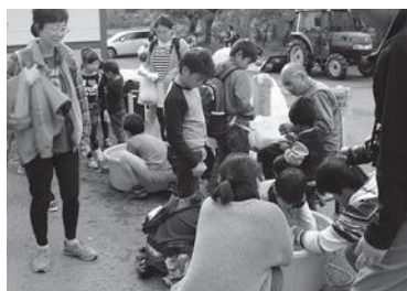
↑金魚コーナー。お客がひっきりなしで店番も大変！