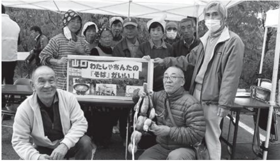
↑山口「わたしゃあんなのそばがいい」 レンコンと玉ねぎのかき揚げが入った 手打ちそばで勝負。