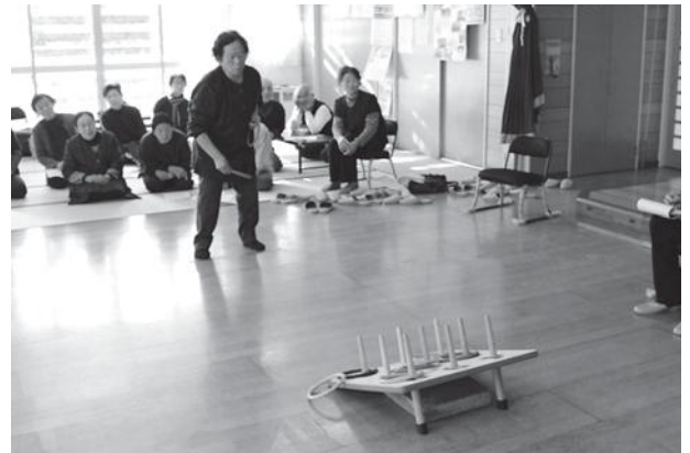
なかなか入らないなー