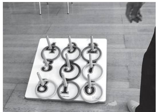
惜しくもパーフェクトならず！！