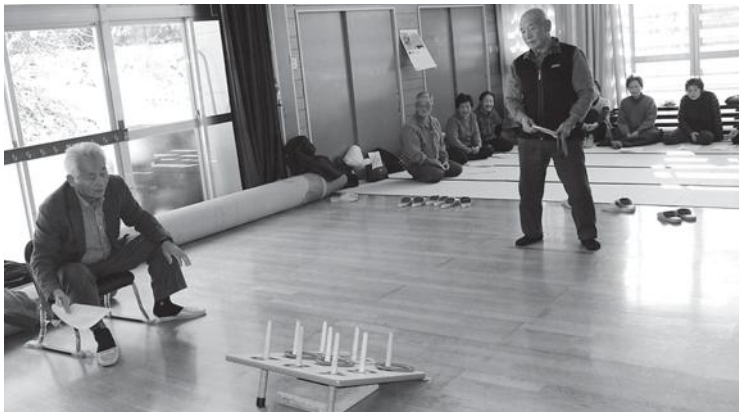
もっと入るように！