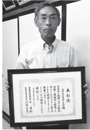
表彰状を手に喜びのお二人