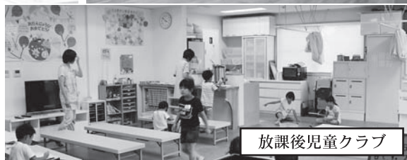
放課後児童クラブ