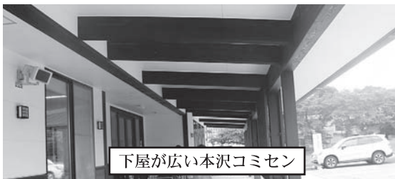
下屋が広い本沢コミセン

両コミセンの説明のなかで、建設にあたっては、基本構想に基づき設計を行うので、途中で設計変更することは難しい。話し合いを重ねて基本構想をしっかりと立てる必要があと話されました。