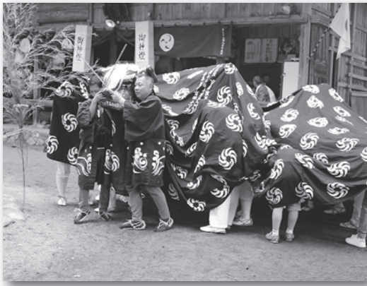
滝野夏祭りの記事は来月号に掲載します。