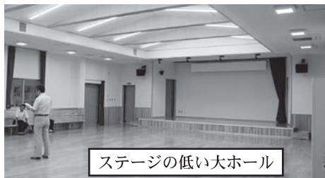
ステージの低い大ホール