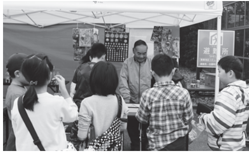
↑くじ引き屋のおじさんの威勢のいい声につられ、つつい財布のひもがゆるむ子どもたち。

また、ワークショップでは、子どもも大人も手作りに熱中して、楽しいひと時を過ごしていました。御協力いただいた多くの皆さんに感謝いたします。