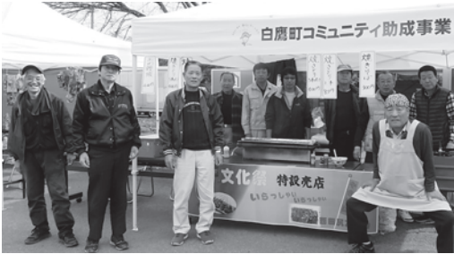
↑西田尻友志会メンバー。「焼き鳥、焼きそばいかがですか～」