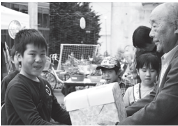
↑おばけかぼちゃは49kgでピタリ賞でした