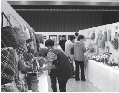
↑「素敵だね」「こんなの作ってみたいね」皆さん熱心に見ています

子どもたちの遊びコーナーは、金魚すくい、射的、くじ引き、わたあめに長蛇の列ができました。