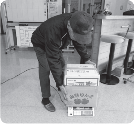
重さはどのぐらいになったべ？ 計量する参加者の方

報告会では、細かく刻んだり、水け を切ってから混ぜ合わせたり、天気 の良い日には乾かしたりと、段ボールが 壊れないようにするのが大変だった。 などの感想も出しましたが、その苦 労の甲斐あって、どれも良質な堆肥が できていたようです。