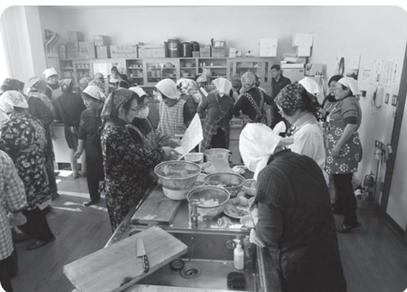
さすがは主婦！それぞれ作業を分担しながら 手際よく調理されていました

また閉級式では、今年度事業を振り返りながら、 来年度への要望なども話し合われました。具体的 には、年度初めの推進委員会でご検討いた だきますが、皆さんからご要望がありま したら、推進委員やハーモニープラザにお願 い致します。みんなで楽しく、有意義な事業に していきましょう。