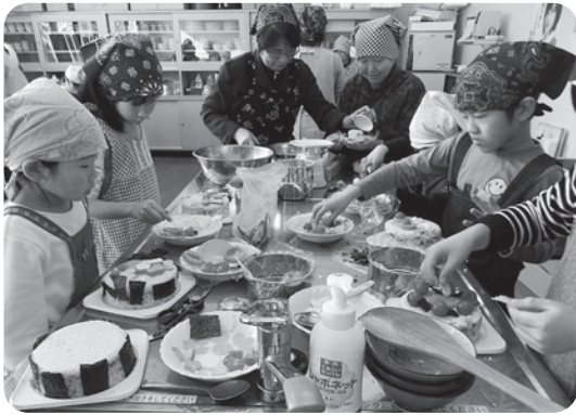
それぞれ自分の好きなように飾り付けていきました

12月17日にふるさと塾（鮎貝小児童対象事業）「げんき弁当子ども料理教室・ケーキずしを作ろう」を21名の参加で開催しました。 健康づくり推進員鮎貝支部、町健康福祉課、農林課との共催事業で、食材で色を付けたご飯といり卵で押し寿司を作り、そこにハムや野菜等で色彩豊かにデコレーションをし、一人1ホール完成させていきました。