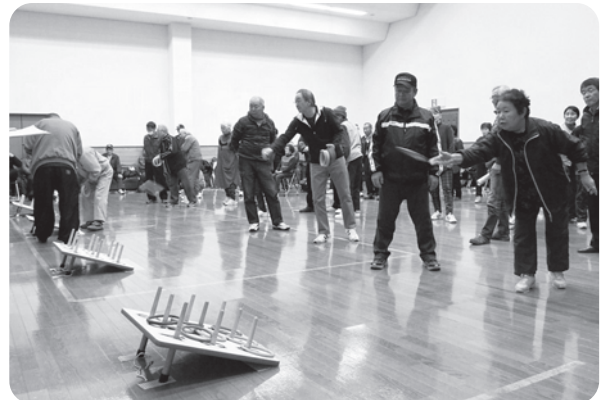
一投一投、指先に神経を集中して投輪する皆さん。輪投げも奥が深い競技ですね。