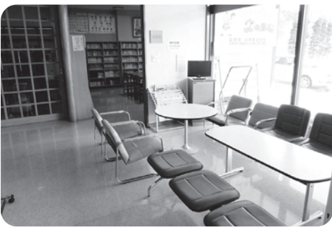
図書室で本を読みながら、友達と一緒にロビーでいっぶくなどいかがですか

みんなに 使っていた だく施設と して、これ からも皆さ んのご要望 などもお聞 きしながら 大切に維持 管理してま いります。