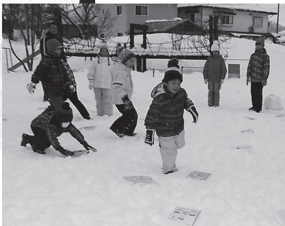
フラッグ、カルタとり 雪の中を駆け回る子どもたち