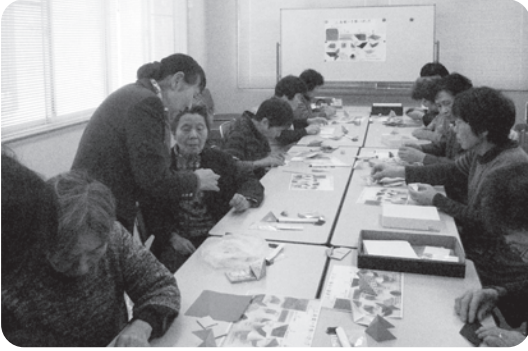
↑隣同士教え合いながら熱心に習いました。

最初に、普通サイズの折り紙三枚で三角錐を作りました。次に、7・5cmの小さい折り紙で折りました。参加者は「どこさ入れんだかわかんにえ」と四苦八苦しながらも「頭の体操になるなく」と楽しみながら黙々と折っていました。リリアンに通すところまでいかず、年末に集まって完成させました。「春がきたみたいだ」と満足して持ち帰りました。