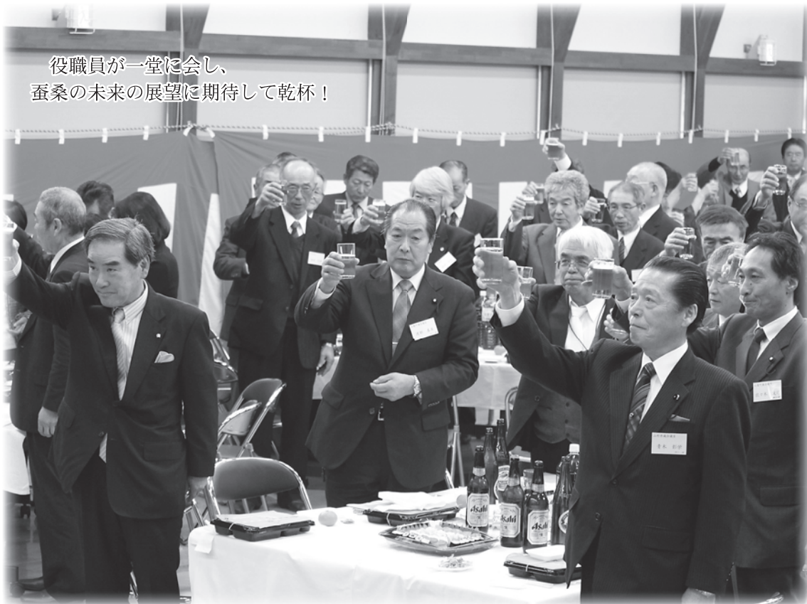
役職員が一堂に会し、 蚕桑の未来の展望に期待して乾杯！