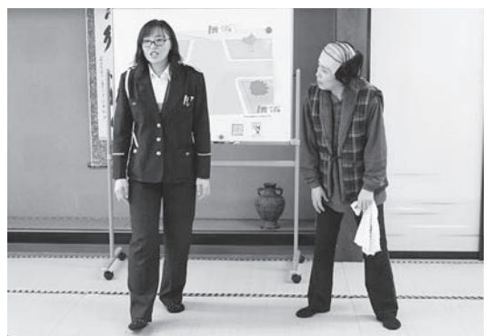
ユッキーあんどヨーコの交通安全寸劇