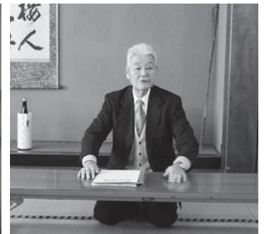
竹田鷹山大学長の挨拶