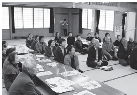
お話を聞く皆さん