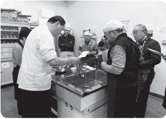
餃子は皮から作り方を 教えていただきました

作った料理を試食しながら、お互いに作った料理の話や趣味の話などで懇親を深めていました。