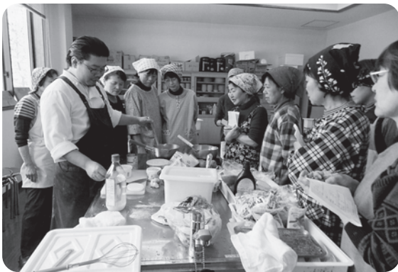
トマトソースの作り方を学ぶ、 参加のみなさん