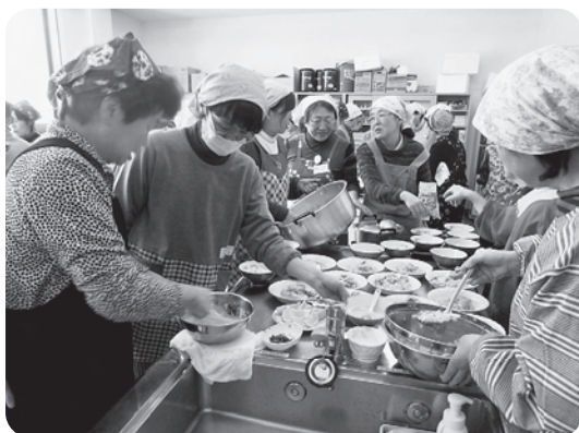
グループ毎、仲良く協力し合っ て手際よく調理する学級生たち