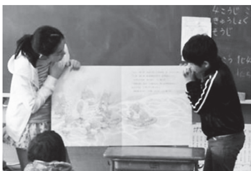
読み聞かせをしてくれた6年生

6年生はみんな優しく頑張り屋で、男女の仲が良く、頼れる存在でした。そんな6年生には特にしっかり感謝して晴れの卒業を祝ってあげたいと思っています。