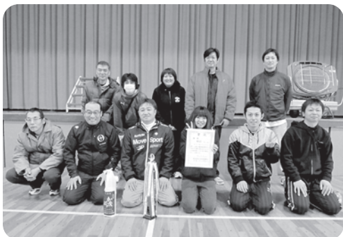
優勝した駅前チームの方々

ソフトバレーボールは駅前チームが優勝 シニア輪投げ大会は森合チーム 社会体育振興会主催の第33回冬季スポーツ大会が1月24日、小学校体育館で開催され、「5人制ソフトバレーボール」に12チームが参加。熱戦の末、駅前チームが3年ぶりに優勝されました。また、1月21日に行われた第21回シニア輪投げ大会では、百名を超える方にご参加いただき、団体戦・個人戦の部で競っていたいただき、結果団体の部で森合チームが優勝に輝きました。尚、この二つの大会をもって今年度の事業は終了となります。これまでの各大会に積極的に協力いただいた分館長はじめ、参加いただいた皆様、来年度もまたよろしくお願い致します。