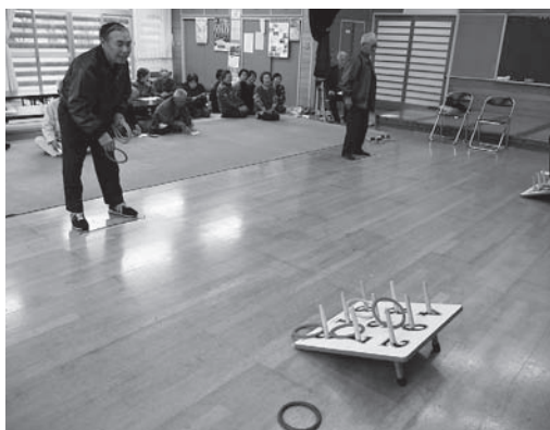
いっぱいに入ったかな?