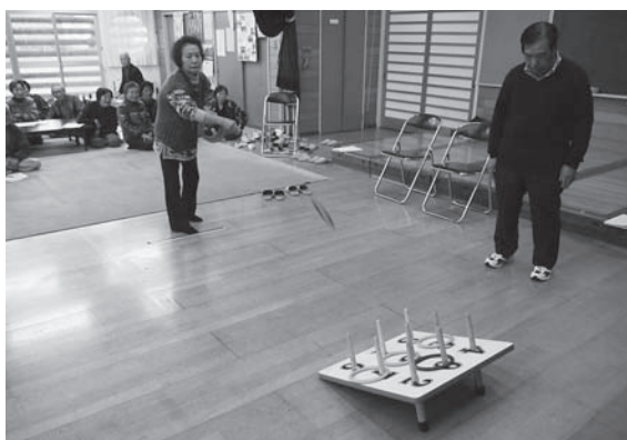
なかなか難しい! 輪投げ