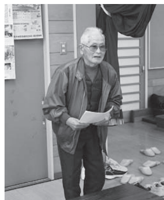
川部審判長 競技上の注意