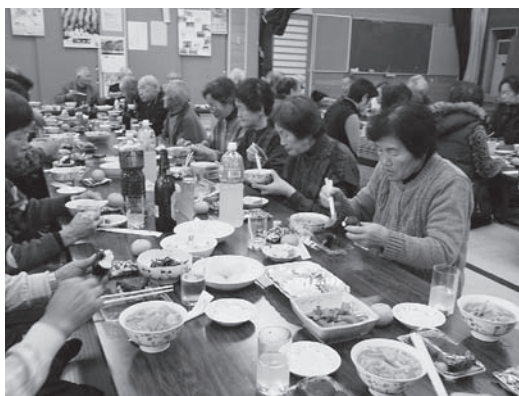
にぎやかに懇親会