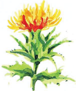
図 1 3 (第 2 条関係)