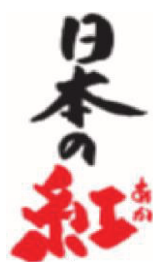
図 7 (第 2 条関係)