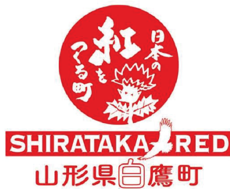
図 5 (第 2 条関係)