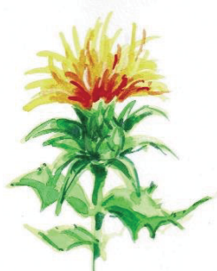
図 1 0 (第 2 条関係)