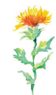
図 9 (第 2 条関係)