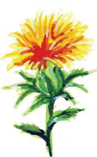
図 1 2 (第 2 条関係)