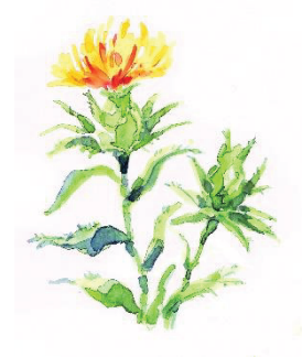
図 1 1 (第 2 条関係)