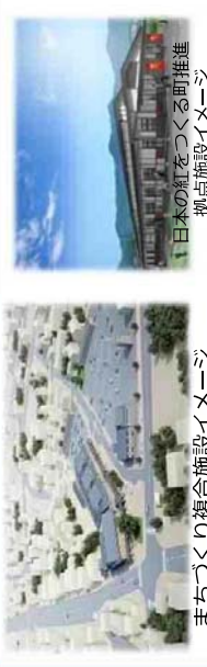
まちづくり複合施設イメージ 日本の紅をつくる町推進拠点施設イメージ

【白鷹町まち・ひと・しごと創生人口ビジョン】 推計目標人口 H32⇒13,500人、H52⇒10,500人 参考：H27国勢調査人口(確定値)14,175人