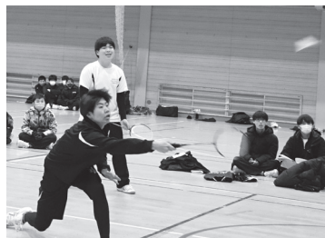
バドミントン ダブルス団体戦

12月23日、荒砥高校3大行事の一つクラスマッチが行われました。今年の種目はバドミントンとドッチボールです。