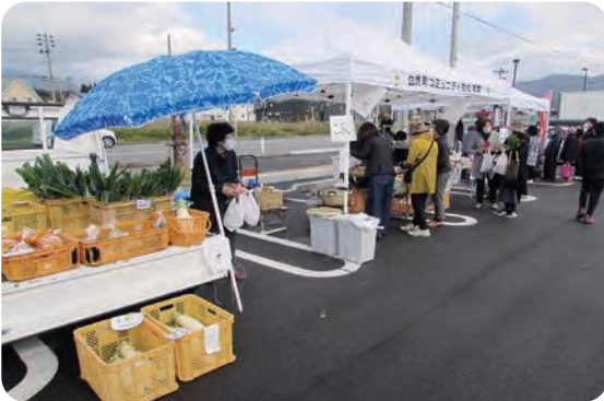
令和2年11月に開催された軽トラ市

ご家庭で採れた野菜や果物、タケノコ、山菜、キノコなど、なんでもかまいませんので、是非出店のご協力をお願いします。