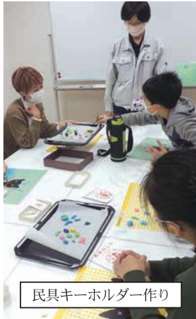
民具キーホルダー作り