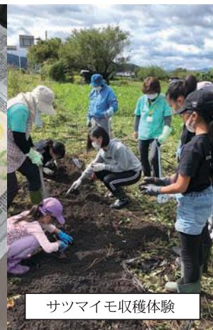
サツマイモ収穫体験