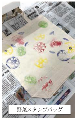
野菜スタンプバッグ