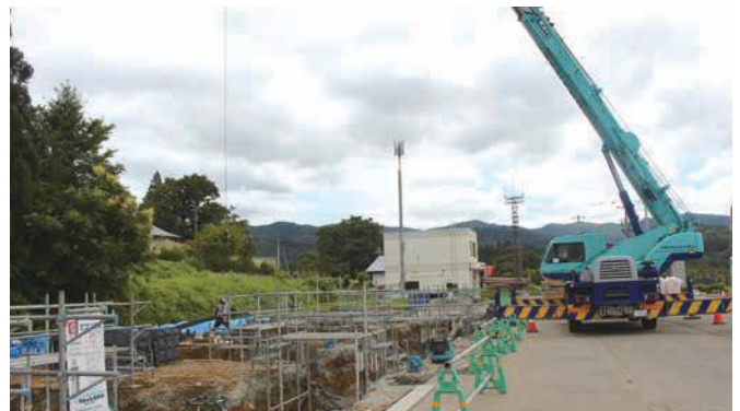
型枠鉄筋搬入、型枠作業