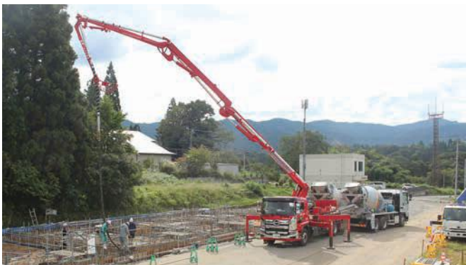
除雪機格納庫 コンクリートポンプ車で生コン打設