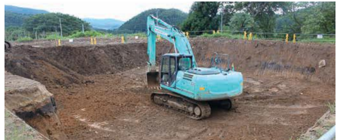
掘削し、土の入れ替え