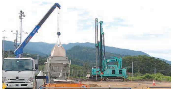
柱状改良杭打込（改良用セメントをバッカープラントへ）