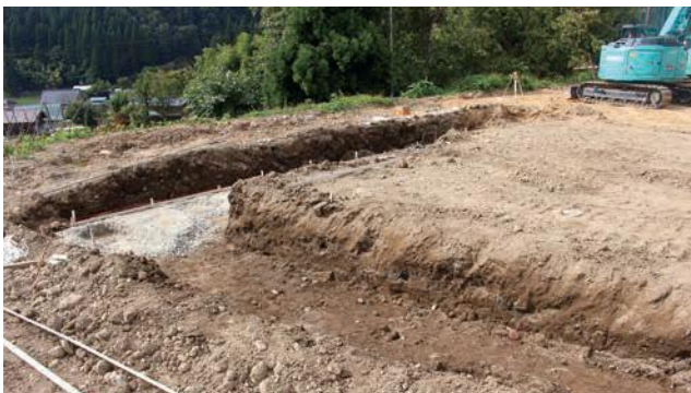
基礎工事掘削作業