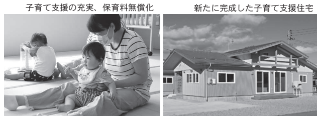
子育て支援の充実、保育料無償化