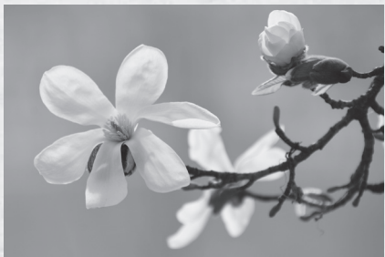
町花でもある「こぶし」 綺麗に咲き誇っていました。

動を継続させていただきなごら、新たな地域の方々の交流や企画もさせていただきたいと考えております。雪解けが落ち着き川が穏やかになったら、バス釣りも力を入れていきます！4月は毎日のように快晴で、役場を飛び出して魅力発信のための写真をたくさん撮影しました。写真は少しずつ地域おこし協力隊のInstagramとFacebookに更新しておりますので、ぜひチェックお願いいたします。白鷹で撮影した動画もYouTubeにアップしていきますので楽しみにしてください！