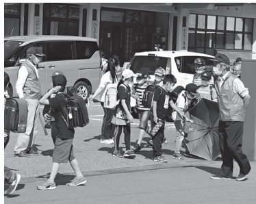
下校時間に合わせ見守り活動を行う隊員の方々（荒砥小）