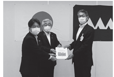
6月23日(木)、要望書を受け取る 西澤総合支庁長(右)