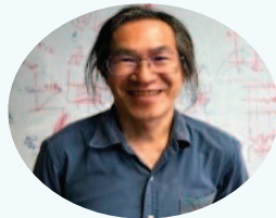
山形大学名誉教授 （宇宙物理学）

日 時：令和5年1月28日(土) 午後1時30分～2時30分 会 場：白鷹町中央公民館 大会議室