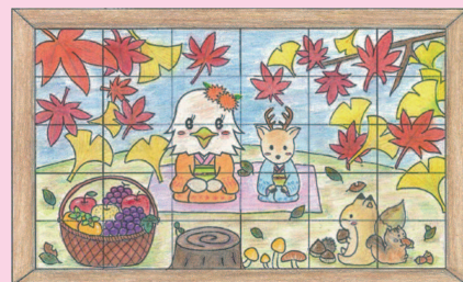
▲1か月チャレンジシートより1日1コマに毎日取り組んで完成された作品です。