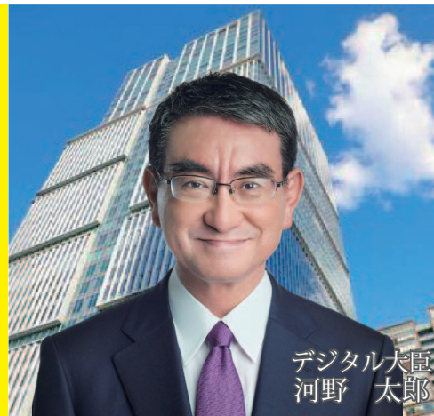
デジタル大臣 河野 太郎