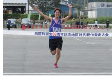
去年の優勝ゴール

来る10月8日（日）町駅伝大会が開催されることになりました。昨年度は、白鷹町ソフトボール球場駐車場をスタート/ゴールとした周回コースで行われ、東根チームは見事初優勝いたしました。今大会は、白鷹町内を周るコース、白鷹町役場がスタート/ゴールとなります。区間は10区間、総距離23.8kmです。