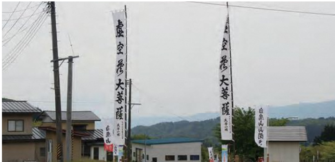
上原町内 白鷹山登山口 祭礼のぼり旗