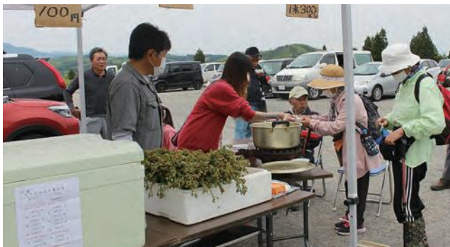
上原町内有志 わらび、ジュース販売