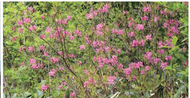
白鷹山 尾根の山つつじ満開