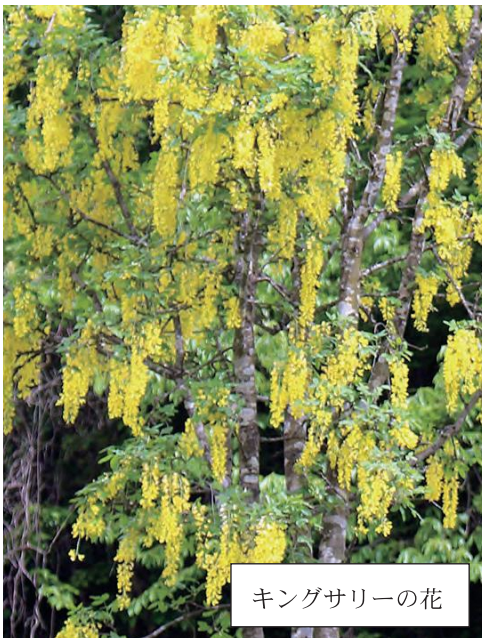
キングサリーの花

◎社会体育振興会の総会ではレクリエーション大会が変わって、地域の方が参加できるスポーツ大会などを事務局で開催方法、種目など検討することになっております。