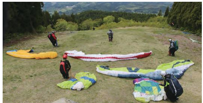
眼下に雄大な最上川 パラグライダー 風待ち準備中