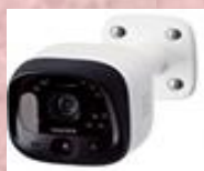
モニター付き屋外カメラ (監視+犯行を思いとどまらせる)