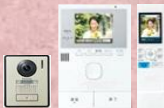
テレビドアホン (まずは訪問者を確認)