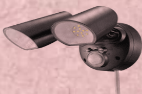
人感センサーライト (侵入者にいち早く気付く)