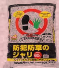
防犯砂利 (踏むと大音量、侵入者退散)