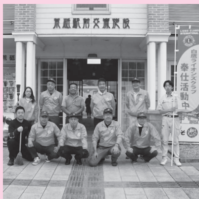
活動していただいた皆さん