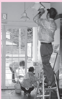
清掃活動 (荒砥駅構内)

駅を利用される方のため、観光で訪れる方のためにと、駅の内外に別れて、ガラス拭き、すす払い、草刈りなど、隅々まで丁寧に清掃を行っていただきました。本当にありがとうございました。