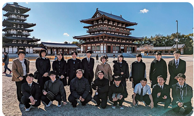
奈良の薬師寺にて

2年生 15名が、12月初旬に、関西方面に修学旅行に行ってきました。1日目は大阪、2日目は大阪から奈良、3、4日目は京都をまわり、晴天のもと充実した旅行を満喫しました。