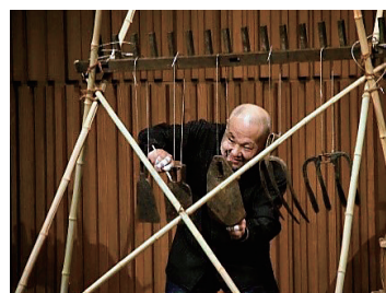
▲バルのように鳴る鋤先