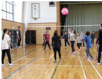
あきらめないで粘る！全ゲームフルセットに持ち込む！

フラバールバレーボールは、いびつな形のボールで、ワンバウンドしてからレシーブするルールがあり、イレギュラーに弾むボールが、なかなか思った通りに返せない！笑いを誘う楽しい競技なのです。各チームは粘りを見せ、全試合が3セットに持ち込まれるなど熱戦を繰り広げていました。