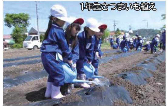
1年生 さつまいも植え