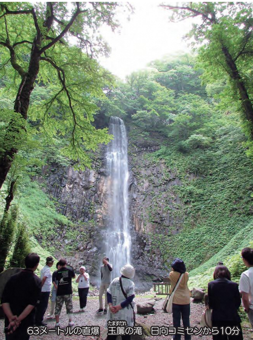
63メートルの直瀑 たますだれ 玉簾の滝 日向コミセンから10分