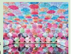
猪苗代ハーブ園では「アンブレラスカイ」で幻想的な世界を演出しています。

期 日／7月12日(金)7:30 集合 形 態／大型バス 会 費／10,000円 申 込／各老人クラブ会長まで ※一般参加の方は直接申込 荒砥コミセン TEL 85-0260 締 切／6月24日(月) ※ 最少催行人数 25名です。