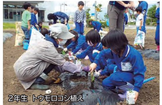
2年生 トウモロコシ植え