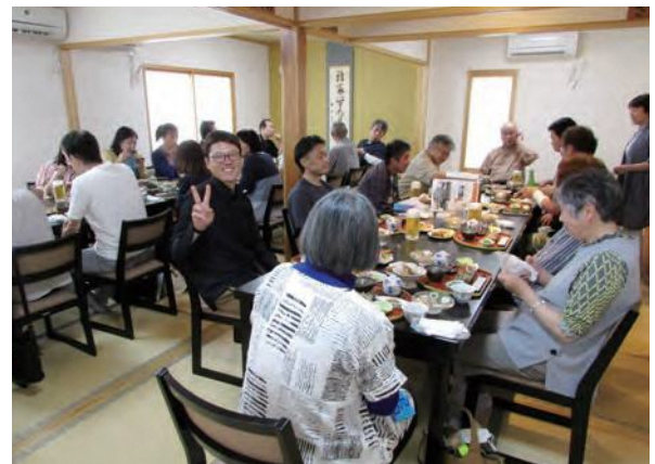
昼食は象潟のお店で日本海の海鮮を堪能！

酒田市黒川地区にある日向コミセンでは住民主体による日向里カフェを運営し、そばやカレーなど大学生のメニュー考案を取り入れランチなどを提供している。また無印良品の監修による手芸品や小物などのセルフレジ販売も行っており、様々な事に前向きにチャレンジしている