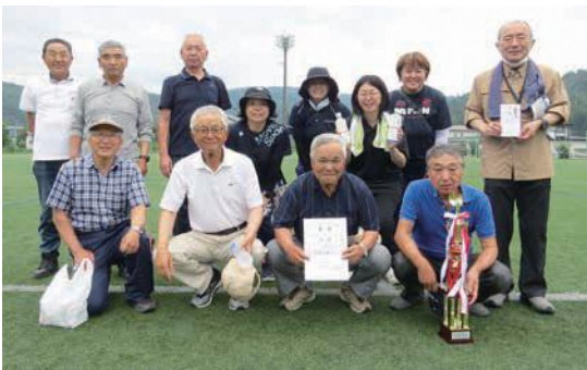
← 優勝した町下チーム