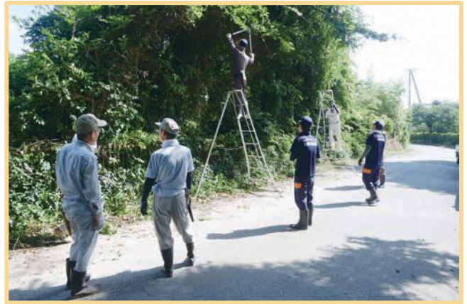
↑↑ 7/21(日) 広野区 ↑↑