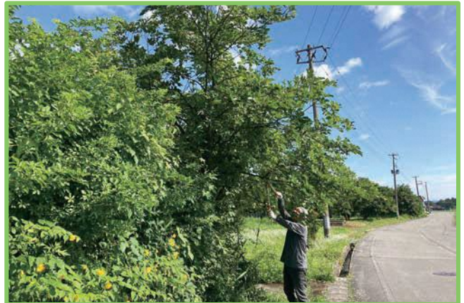
↑↑ 7/21(日) 浅立区 ↑↑