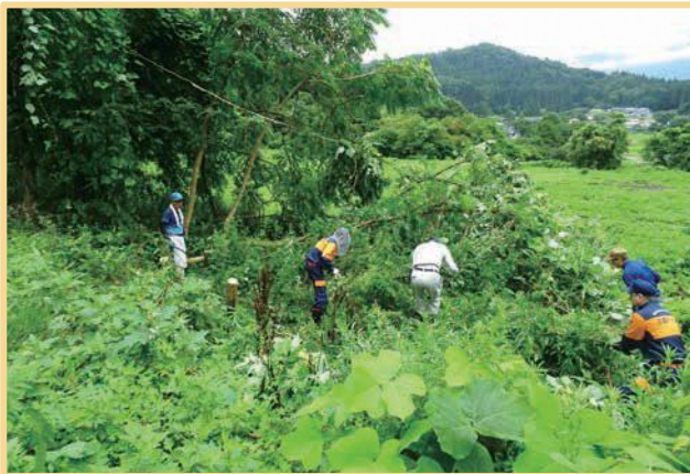
↑↑ 7/20(土) 小山沢区 ↑↑