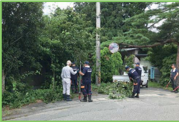
↑↑ 7/28(日) 町下区 ↑↑