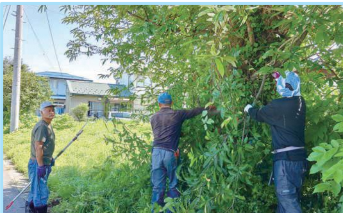
↑↑ 7/21(日) 杉沢区 ↑↑

毎年実施しております支障木の伐採作業を、7月中旬から下旬にかけて各区ごとに行いました。 今年度も長井地区交通安全協会東根支部と消防団第5分団にご協力いただき、道路にはみ出し、交通事故の要因になる事が懸念される樹木を伐採しました。 年々暑くなる中、作業に参加して頂いている役員や地区の皆様にはいつも頭が下がります。ご協力いただきました皆様、本当にありがとうございました。