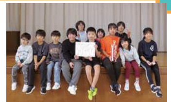
↑準優勝 浅立子ども会