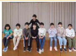
←4位 小山沢・杉沢 合同チーム