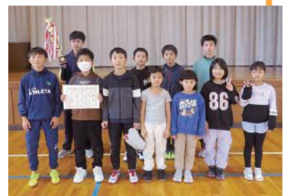
↑優勝 町下子ども会

12月1日(日)東根小学校体育館に43名が参加し、球技大会(種目 ドッジボール)を開催しました。