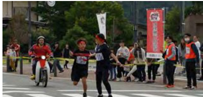
6区→7区 姉弟でのタスキリレー