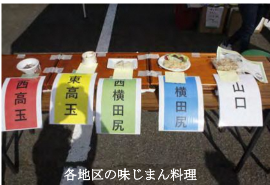
各地区の味じまん料理