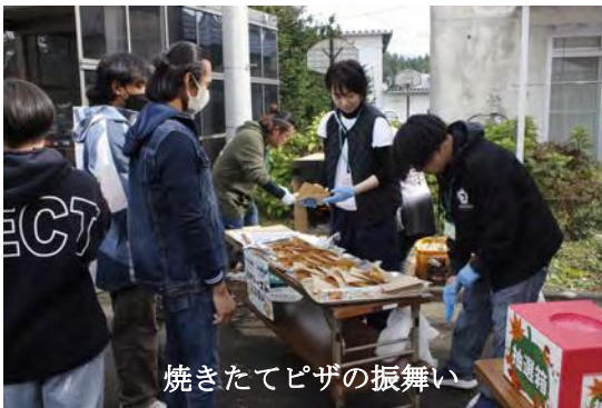
焼きたてピザの振舞い