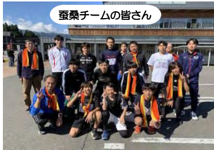
蚕桑チームの皆さん

10月13日、地区対抗駅伝競走大会が行われました。今年は例年より早くから練習会を計画し、月2回の練習会と現地試走会を行いました。結果は7位でしたが、区間賞が1名と初出場が3名おり、来年の上位入賞に期待が持てる大会となりました。練習会、当日と頑張ってお走っていただいた選手の皆さん、練習にご協力いただいた役員の皆さん、選手のご家族、そして応援していただいた地域の皆さん、ありがとうございました。