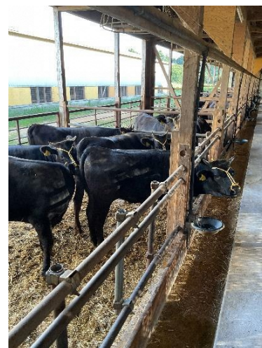
こちらは子牛の牛舎