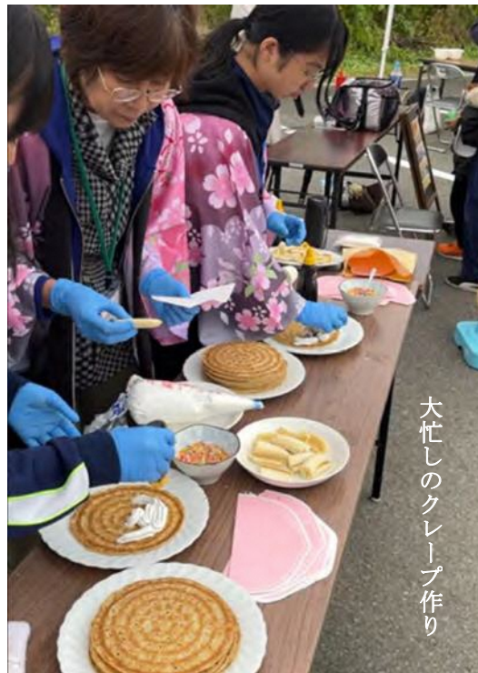
大忙しのクレープ作り