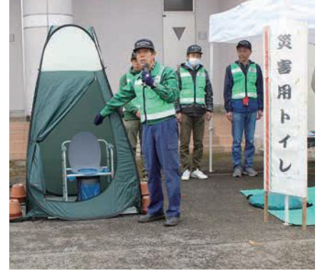
簡易トイレ設置の説明