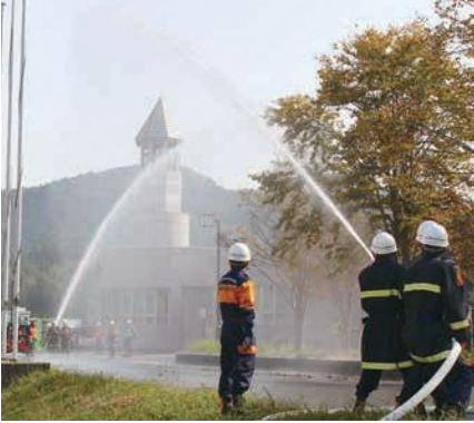
4分団火災防衛訓練 一斉放水