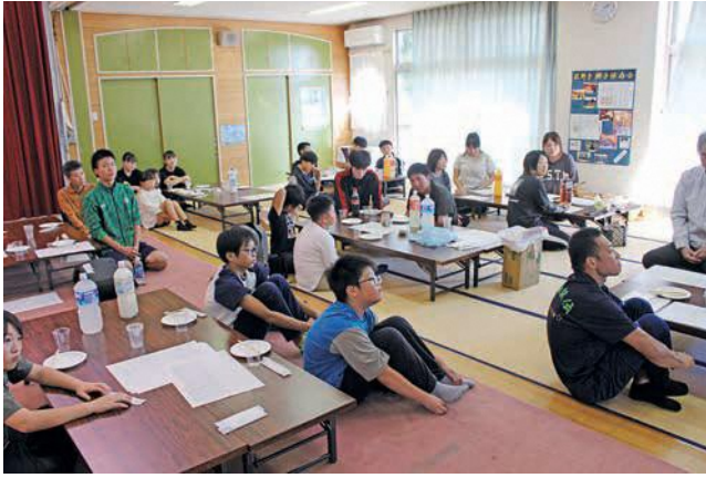
萩野ふれあい館で反省会