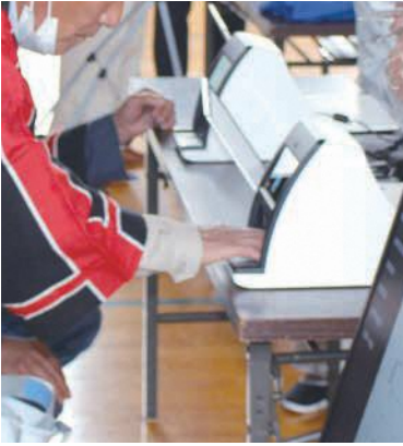
マイナンバーカードで避難者受付訓練

様々な訓練を行った中で、災害用簡易トイレ設置、電気とガソリンで走ることができ、充電した電気を家庭用として利用できる車(PHEVプラグインハイブリッド車)などは興味深いものでした。トイレの準備を検討します。