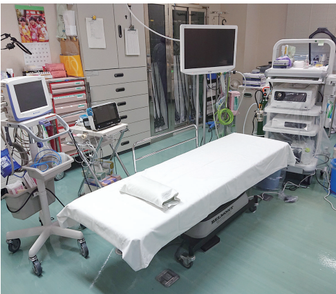
メンテナンスが大事

【当局】減価償却は、建物は毎年一定額、その他は医療機械が多い。医療機械の中には、耐用年数が過ぎたものもあるが、提供する医療サービスには影響が出ないようしっかりと保守やメンテナンスをすることで使える間は長く使っていきたい。