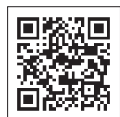
母子手帳アプリ 「紅ほっぺ」