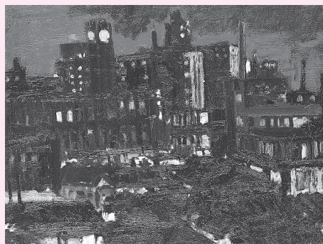
▲梅津五郎 《下落合風景》1989