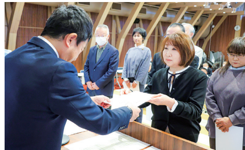
▲民生委員・児童委員の54人に田宮副町長から委嘱状が手渡された

活動を行うにあたって、個人の人格を尊重し、その秘密を守ります。差別的、優先的な取り扱いもしてはいけません。