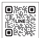
小児科 オンライン相談