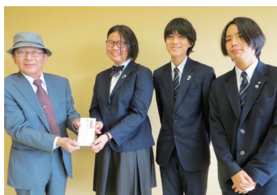
文化祭の売上の一部を寄附