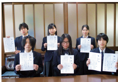
やる気と決意みなぎる生徒会役員