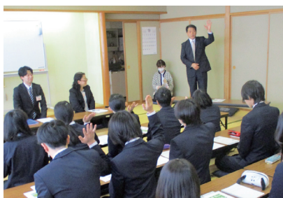
国民の義務、自分と家族のために