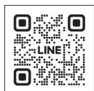
産婦人科 オンライン相談

※オンライン相談の登録には、白鷹町専用の合言葉が必要です。こども家庭センターにお問い合わせいただくか、母子手帳アプリ「紅ほっぺ」をご覧ください。