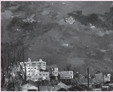
梅津五郎 《緑色の太陽》2000