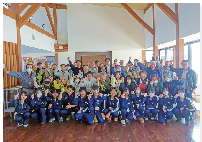
▲参加した皆さんで記念写真

フェアは、持続可能な社会の実現を目指し、環境負荷の低減に向けた大切な取り組み「4R」のテーマを中心に実施されました。「Refuse(断る)」「Reduce(減らす)」「Reuse(再利用)」「Recycle(再資源化)」の考え方で、ゴミの排出量を削減し資源の効率的な活用を進める重要性について知るブースを設置。来場者の皆さまは楽しみながら学び、家庭で取り組める簡単な「4R」のアイデアを実践的に学ぶ機会となり、私たちができる地球環境を大切にする一歩について考えるきっかけになりました。