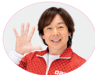
ひろみちお兄さん

当日スムーズに説明会にご参加いただくため、事前に産婦人科・小児科オンライン相談および母子手帳アプリ「紅ほっぺ」にご登録ください。