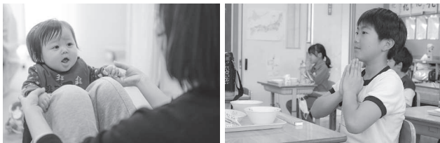
小学校給食費無償化による子育て世帯の負担軽減