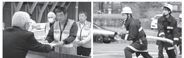
防災力を維持し地域の安全安心を守る