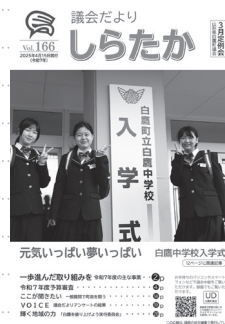
議会だよりしらたか