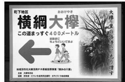
←土里夢館前の看板

町下公民館事業の一環として行ってきた盆踊り大会が今年で50回目を迎え、また、土里夢館建設後から行ってきた花火大会が20回目を数えることとなり、紅白幕や花笠、案内看板等を新調し、記念の事業として盛り上がることができました。そして地域の方々の結びつきがより一層強まりました。