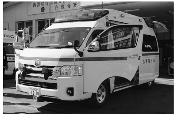
平成17年1月に運用を開始した救急自動車に代わり、より安心・安全に救急要請に対応していく